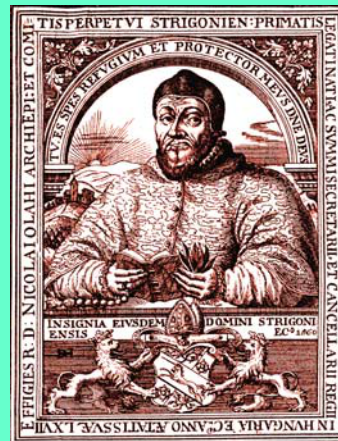
Nicolaus Olahus (1493 - 1568)