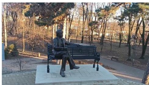
Parcul „Mihai Eminescu” Botoșani