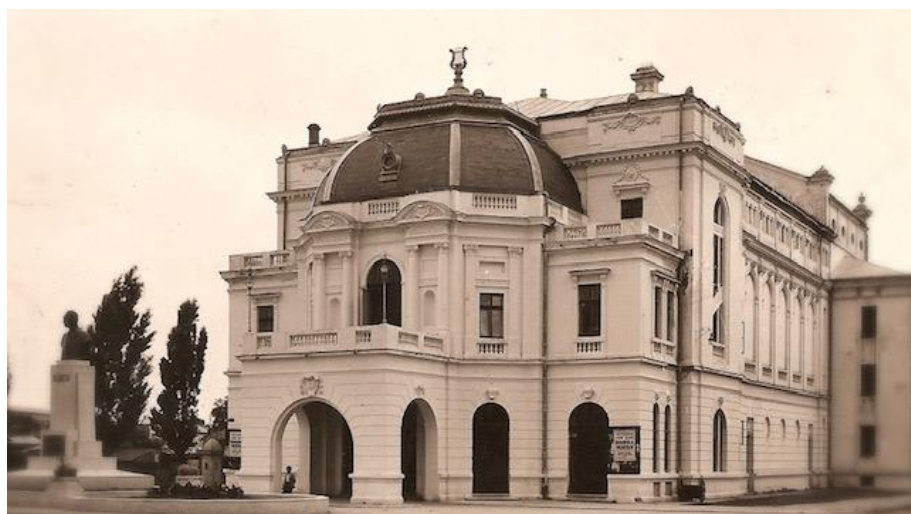
Teatrul „Mihai Eminescu” Botoșani